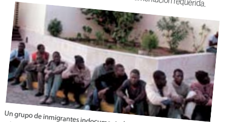
Un grupo de inmigrantes indocumentados detenidos por la Policía migratoria española en la ciudad de Melilla.

La denominada inmigración ilegal o indocumentada incluye tanto a las personas que ingresan de manera clandestina en un país, es decir, que atraviesan las fronteras sin realizar los trámites de ingreso necesarios, como a los extranjeros que residen en un país sin contar con los permisos correspondientes (de residencia, de estudio o de trabajo). En este caso, la ilegalidad es una situación administrativa; estos inmigrantes no han cometido ningún delito, sino una contravención: no cuentan con la documentación requerida.