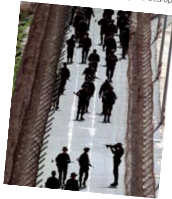
Frontera de Melilla, en el norte de África, donde los migrantes africanos intentan saltar las vallas vigiladas para ingresar a ese enclave español.

Las políticas migratorias abarcan tres aspectos centrales: el control de la entrada y la salida de población migrante, la regulación del mercado de trabajo en relación con la población inmigrante y la integración social de los inmigrantes en las sociedades de destino. En el caso de los países de la Unión Europea, las políticas migratorias son cada vez más restrictivas, pues buscan limitar y controlar el ingreso de inmigrantes de acuerdo con las necesidades del mercado de trabajo. En la actualidad, muchos países europeos fomentan una política de inmigración selectiva, es decir que sólo reciben a las personas con mayor calificación laboral. Este tipo de políticas favorece el crecimiento de la denominada inmigración indocumentada , porque muchos trabajadores poco calificados –generalmente provenientes de África– intentan ingresar a Europa de manera clandestina.