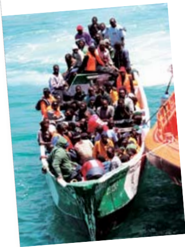
Una precaria embarcación de madera que funciona con motor, denominada cayuco, con migrantes africanos que intentan llegar a Europa.

En 2005, los países de Europa recibieron el 34% de las personas emigradas de América latina, Europa oriental, Asia y África. En esta dinámica migratoria, la migración de africanos a Europa ha adquirido gran repercusión. Este fenómeno se intensificó después de la Segunda Guerra Mundial. En ese momento, el desarrollo económico que experimentaron algunos países europeos requirió mayor cantidad de mano de obra; como esas naciones habían sufrido grandes pérdidas humanas durante la guerra o su población presentaba tasas de crecimiento muy bajas, promovieron la inmigración. Los flujos se produjeron, inicialmente, desde las colonias hacia sus metrópolis, por ejemplo, desde Senegal hacia Francia. Sin embargo, luego de la descolonización, la situación de muchos países africanos no mejoró; las causas de las migraciones –malas condiciones de vida, hambrunas, guerras– continúan en la actualidad e impulsan a muchas personas a buscar trabajo y una vida mejor en Europa.