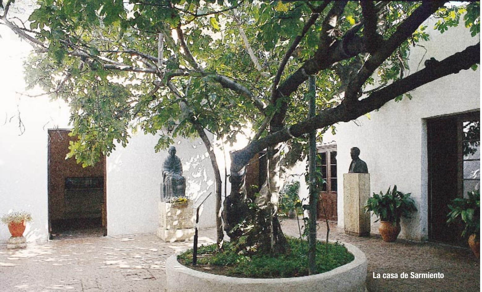
La casa de Sarmiento

Un puñado de argentinos se lanzaron a soñar con una realidad más cercana a sus deseos y concibieron proyectos que acercaran a su país a lo mejor que fueron conociendo en otros lados. Era una utopía. Pero pertenecían a una generación de utópicos y hacedores que hoy puede parecernos extraña: no se quejaban de su suerte, estudiaban por propia voluntad en forma autodidacta y arremetían con los problemas por propia iniciativa y contra toda esperanza, haciendo lo que creían con inteligencia, perseverancia y pasión.